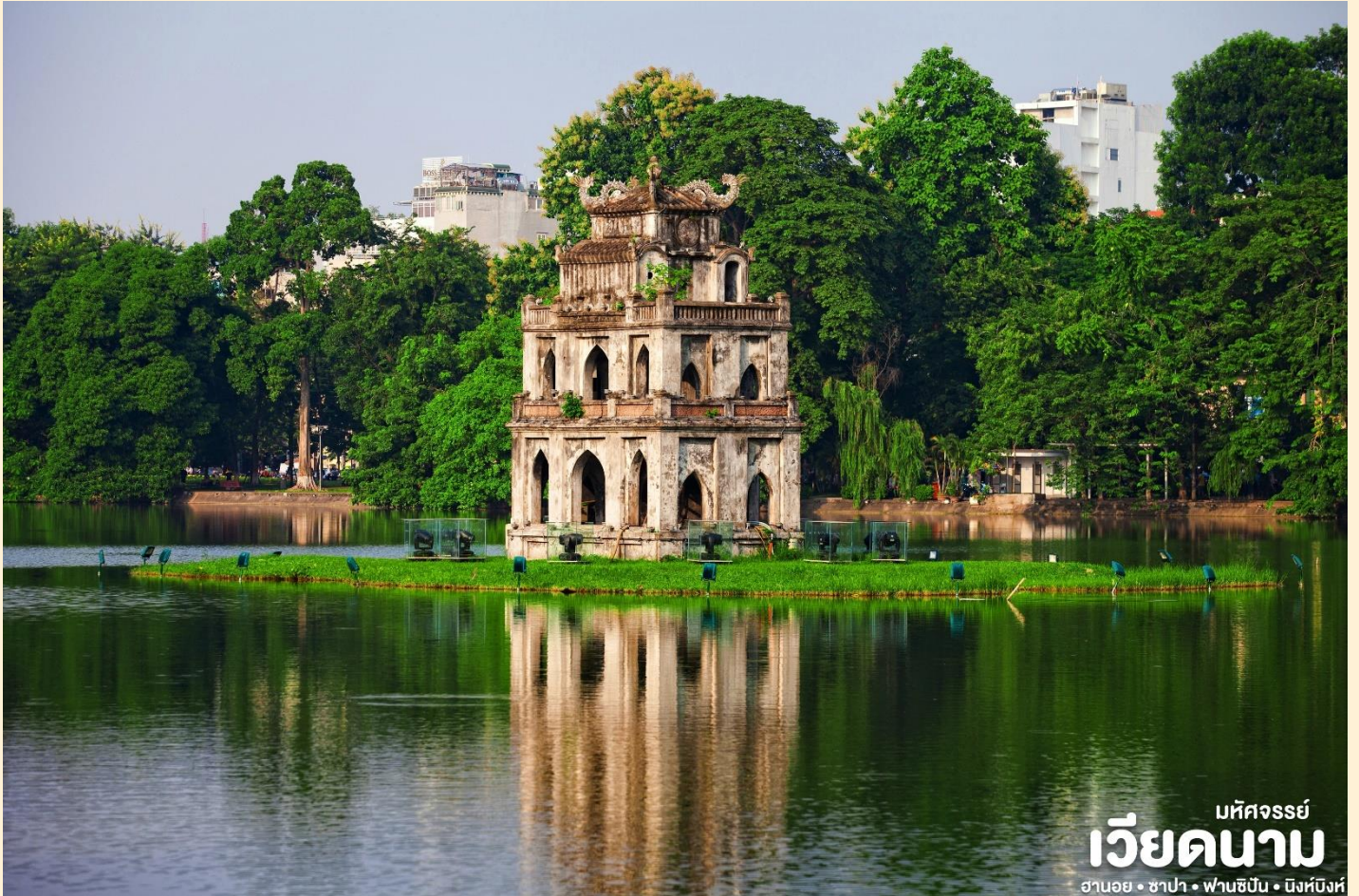
มัทศจรรย์ เวียดนาม ฮานอย • ซาปา • ฟานซิง • นิงห์ฮิงห์