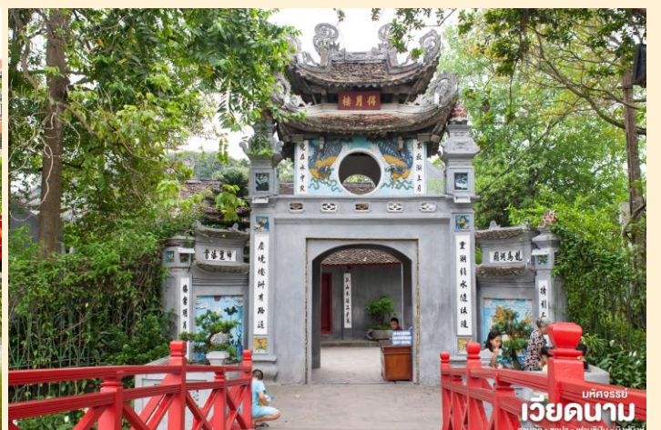
มัทศจรรย์ เวียดนาม ฮานอย • ซาปา • ฟานซิง • นิงห์ฮิงห์