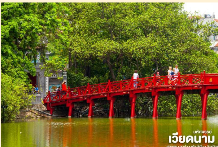
มัทศจรรย์ เวียดนาม ฮานอย • ซาปา • ฟานซิง • นิงห์ฮิงห์